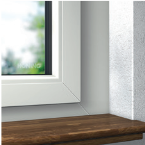
Optik eines kombinationsgeschweißten Blendrahmens