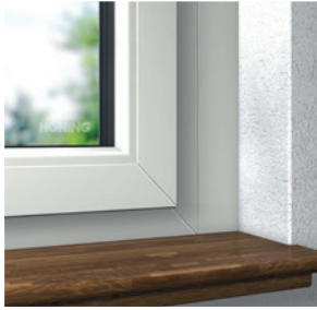
Optik einer herkömmlichen Blendrahmenverbreiterung

Um einen besseren Wärmeschutz, optimale Dichtheit gegen Zugluft und Schlagregen sowie einen wesentlichen Gewinn für die Fensteroptik zu erzielen, ist das Kombinationsschweißverfahren die richtige Wahl. Bei dieser Fertigungstechnik können unterschiedlich breite Blendrahmenprofile miteinander verschweißt und auf geringste Ansichtsbreiten optimiert werden – ganz ohne Rahmenverbreiterungsprofile und störende Stoßkanten.